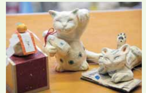
ユーモラスな作品たち