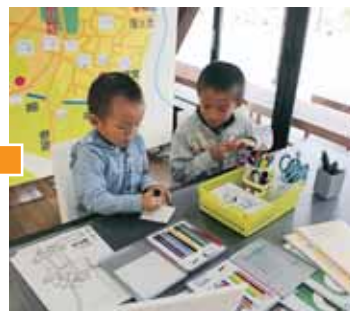
お家の絵に色を塗ります

平泉寺歴史探遊館まほろばは、昨年10月6日に開館してから1周年を迎えました。そこで、10月3日から14日まで「まほろばウィーク」として様々なイベントを開催したところ、3075名の方が来館されました。