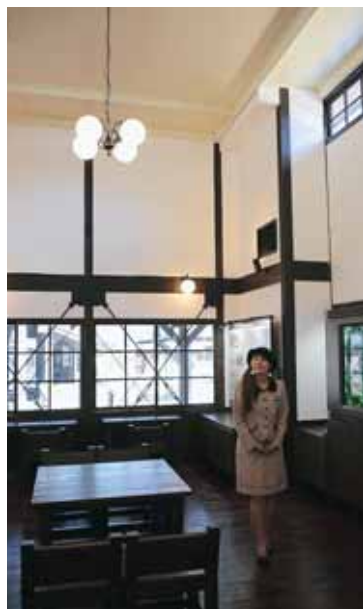
新しい待合室はレトロな雰囲気

えちぜん鉄道を今後も残していくために、みんなで力を合わせて「乗って残そう運動」を持続させていくことが、本当に大事だと思います。