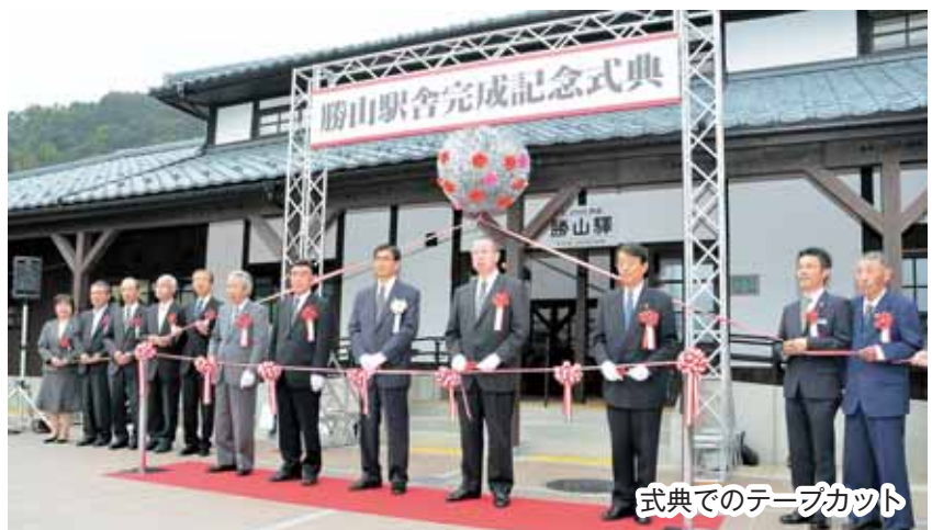
式典でのテープカット

10月19日に、勝山駅舎改修と周辺整備の完成記念式典を行いました。式典終了後は、えちぜん鉄道全線開通10周年を記念したイベントが開催されました。お昼に運行された臨時列車は、鉄道ファンや家族連れでほぼ満員になりました。駅前ロータリーを会場にしたイベントでは、ステージでの演奏や飲食ブースに大勢の人が訪れていました。