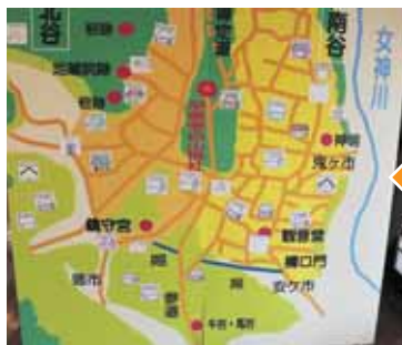
平泉寺の地図に貼って六千坊をイメージします

「平泉寺は日本の中世における地域寺院として遺跡の内容、整備のトップランナーです。」