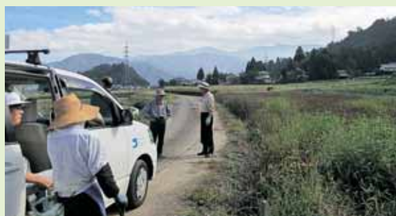
パトロールの様子

「農地の買い手、借り手を見つけてほしい」「耕作してないと思うの？」「農地転用の手続きについて教えてほしい」など、農地に関する疑問は、担当地区の農業委員や左記までお気軽にご相談ください。 問 農業委員会事務局(市役所1階) ☎88・8115