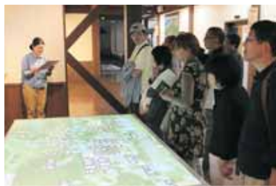
大勢の来館者で賑わいました