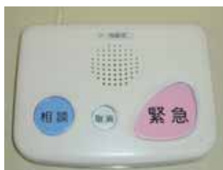
緊急通報システム