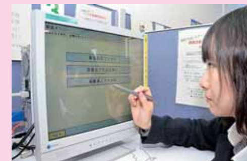
タッチパネル式で検索も簡単!