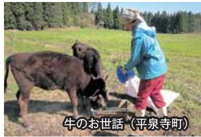
牛のお世話(平泉寺町)

■ 住み込みでお手伝い 勝山市では平成20年度から田舎暮らし体験交流事業を実施しています。この事業は、都会からの参加者が市内の各農家から食事と宿泊先の提供を受けて、農作業などを手伝う仕組みとなっています。