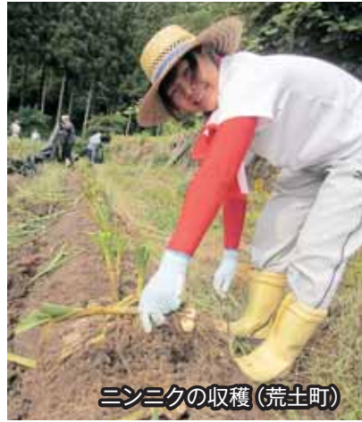
ニンニクの収穫(荒土町)