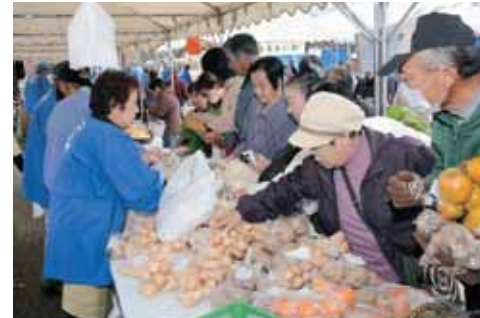
にぎわうシルバーフェスタ(10月)