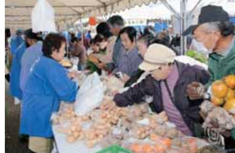
にぎわうシルバーフェスタ(10月)