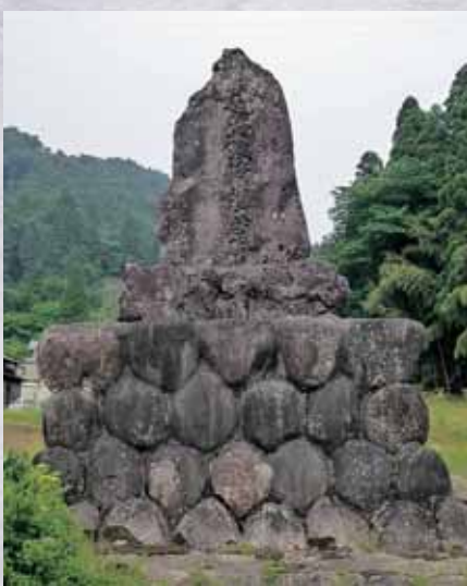
三段から成り、総高は4.3メートルにも及ぶ