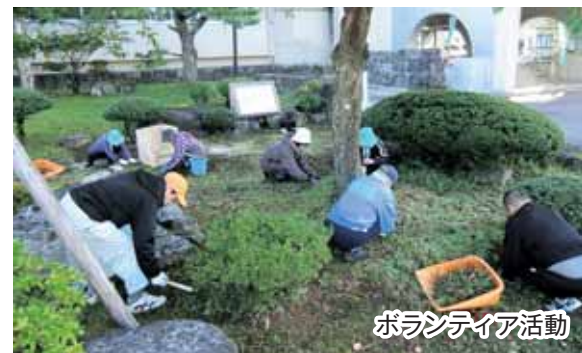
ボランティア活動