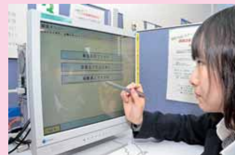
タッチパネル式で検索も簡単!