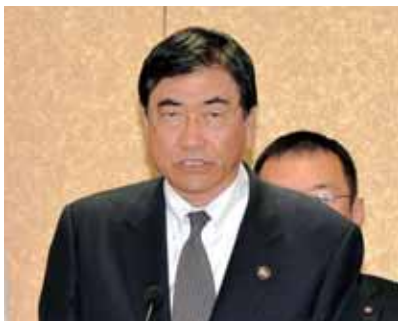
招集あいさつをする山岸市長