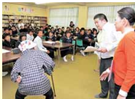
勝山北部中学校での認知症講座の様子

認知症の方を支える 成年後見制度 認知症などのために判断能力の不十分な方は、財産を管理したり、介護サービスや施設への入所に関する契約を結んだりすることが難しい場合があります。また、金銭搾取や悪徳商法の被害に遭う恐れもあります。このような方に代わって、財産管理や契約締結などを行うのが「成年後見制度」です。 成年後見の申し立ては家庭裁判所に行うこととなりますが、地域包括支援センター「やすらぎ」では、制度に関するご相談や申し立ての支援を行っていますので、ご利用ください。