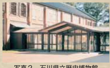
写真2 石川県立歴史博物館

夏のある日、石川県立歴史博物館で会合があった。そのとき「マンダラー―チベット・ネパールの仏たち―」という、国立民俗学博物館の所蔵品であるマンダラーや仏像・神像の特別展があった。百九十数点展示されているが、筆者の理解力を超えるものであった。この特別展と同時に「北陸の曼茶羅展」が開催されていた。羽咋市の正覚院が所蔵する両界曼茶羅や金胎灌頂三昧耶形敷曼茶羅、博物館が所蔵する白山曼茶羅と星曼茶羅が展示されていた。