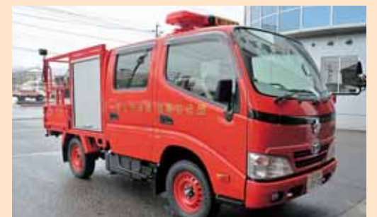
写真上：新車両 写真右：小型ポンプ昇降装置

12月18日(火)、勝山市消防団第10分団(鹿谷地区)の消防団車を更新しました。車両には、小型動力ポンプの積み降ろし作業を軽減させる機械式昇降装置が搭載されています。なお、同分団ポンプ庫も新しくなりました。