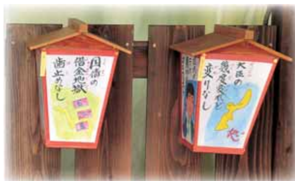
※写真は昨年の絵行燈の一部