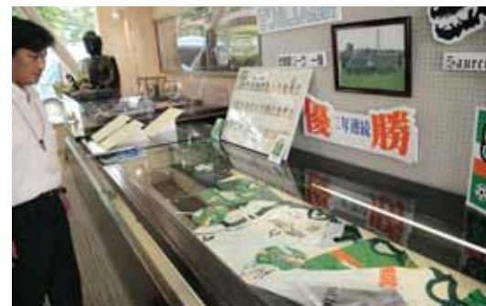
教育会館にはユニフォームなどのグッズが展示されています

7月30日、NPO福井にJリーグチームをつくる会（サッカーチーム「サウルコス福井」の運営母体）と勝山市が包括的連携協定を締結しました。 サウルコス福井のチーム名が「恐竜」に由来していることから、「恐竜のまち」勝山市との連携協定が実現しました。