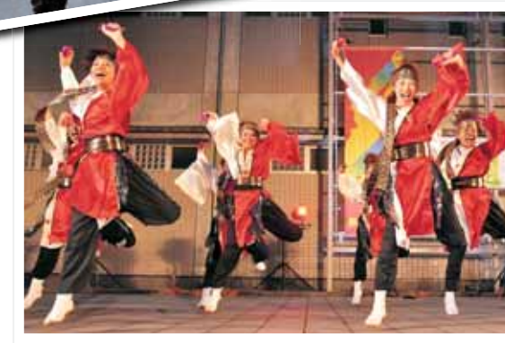
かつやまワッショイ2013 参加チーム一覧 (演技順)