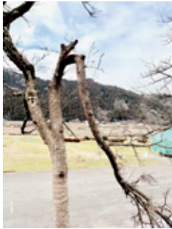
着雪で枝折れした桜

こうして育まれた桜並木は、春になると見事な「桜のトンネル」となり、地域を代表する名所として多くの人々を魅了しています。