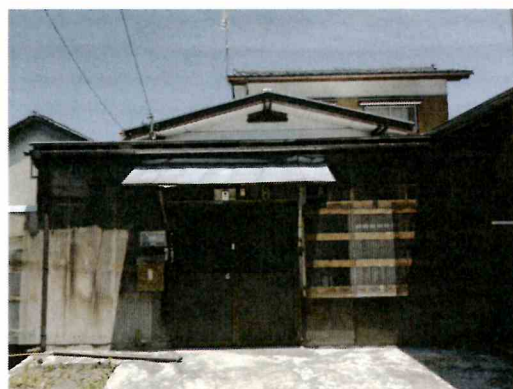
正面ポーチ 兼 作業場