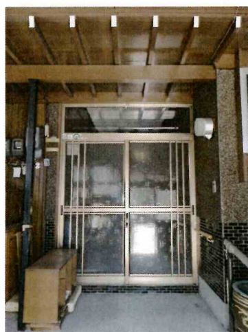
正面ポーチを入ると居宅の玄関がある