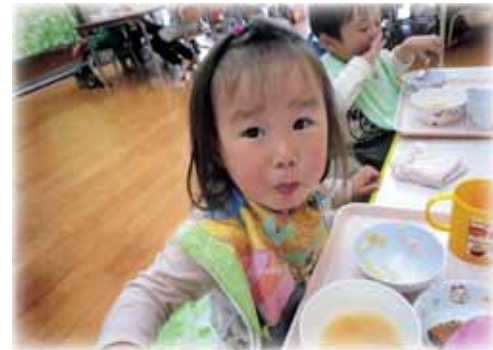
おいしい給食・手作りおやつ

保護者の就労や疾病などにより、家庭で保育できない児童を預かり(養護)、教育する福祉施設です。 生涯にわたる人間形成の基礎を培うとても大切な時期によりよい環境を整え、児童の成長・発達を保障することに重きをおき、心身共に健全な育ちの支援をしています。