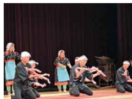
アトラクション：片瀬の銭太鼓

エコミュージアムの活動理念は「住民による」が不可欠であり、まちづくりの切り札は「バカ者・キレ物・よそ者」です。皆さま方の更なるパワーを期待し“YES WE CAN”有難うございました。