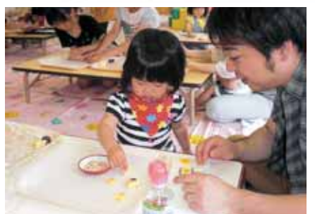
パパとクッキー作り