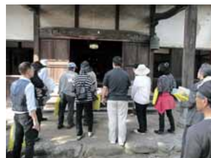
③コース 開善寺見学