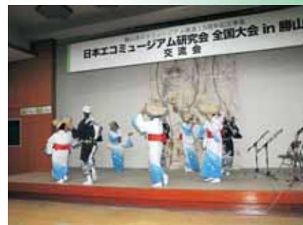
アトラクション：北谷町の昔おどり