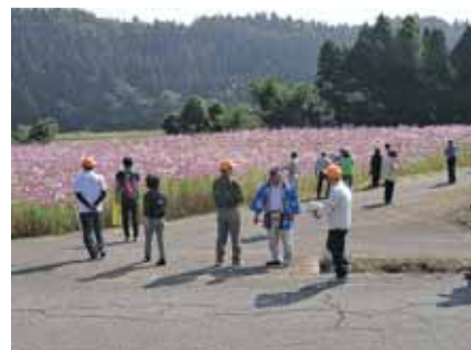
④コース 野向町コスモまつり