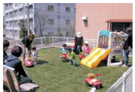
芝生広場もあります