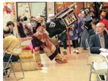
アトラクション：谷のはやし込み行列