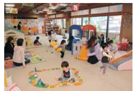
センター内の様子

※「カンガルーのお部屋」の行事案内は、「広報かつやま お知らせ版」に毎月掲載されていますのでご覧ください