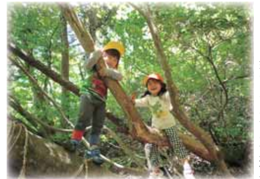
自然の中でのびのび遊ぶ

新規入園受付▶ 入園対象 保護者の就労などにより、家庭内で保育が受けられない産後8週以上(H27.4.1現在)の就学前児童 受付期間 12月1日(月)～25日(木) 午前8時30分～午後5時15分 ※土日祝日を除く ※郵送の場合は12月25日必着 提出書類 ・H27年度保育園入園申込書 ※11月21日(金)から福祉・児童課で配布 ・保育を必要とする理由を証明する書類(勤務証明書など) 提出先 福祉・児童課