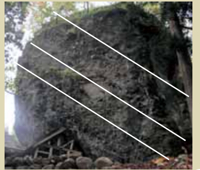
巨大岩塊の成層構造の様子