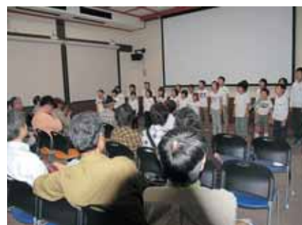
①コース 平泉寺小学校の発表

市内でのまちづくりの取り組み・成果を見てもらうために、市内を5コースに分け、参加者に視察してもらいました。 ①まほろばコース（平泉寺） ②ジオ体感コース（猪野瀬、遅羽、鹿谷） ③まちプラコース（勝山） ④自然満喫コース（野向、北谷、村岡） ⑤昔の暮らし体感コース（北郷、荒土） また、11日の夜は交流会が開催され、アトラクションとして、谷のはやし込み行列、北谷町の昔おどり、勝山左義長ばやし保存会による演舞が披露されました。会場では勝ち山おろしそばをはじめ、勝ち山の郷土料理がふるまわれました。