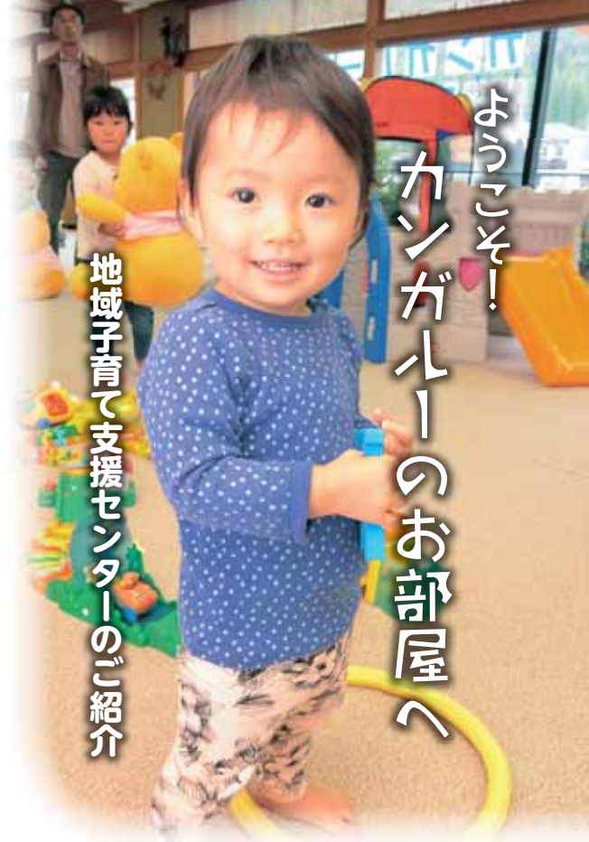
地域子育て支援センターのご紹介