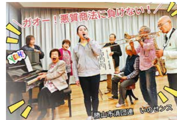
講師① いのセンス 替え歌 懐かしの歌をまじえて心に響く啓発を実施中！

手を変え品を変えやってくる悪質商法。大切な財産を守るため、だまされないようにするため、被害防止の出前講座を行います。