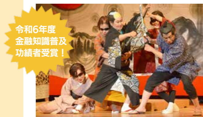
講師② くらしの一座 寸劇 映画「えちてつ物語」出演など、県内で活躍中！

出前先▶市内 定20講座(先着順) 申・問勝山市消費者センター（市役所1階） ☎88-8103