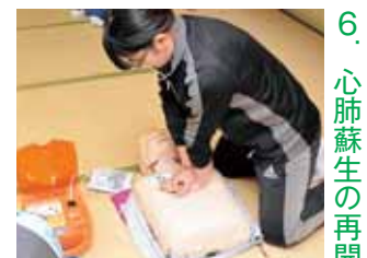
6. 心肺蘇生の再開 電気ショック完了後、ただちに心臓マッサージを再開する

心臓マッサージを再開して2分ほど経つと、再びAEDが自動的に心電図の解析を行いますので、音声メッセージに従って傷病者から離れてください。以後は、4〜6の手順を2分おきに繰り返し、救急隊の到着を待ちます。