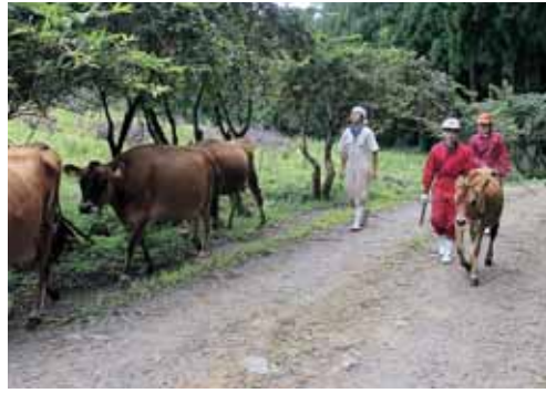
牛のお世話（平泉寺町小矢谷）