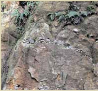
円礫が入る地層（野向町牛ヶ谷）

野向町牛ヶ谷集落には、「大道谷層」と呼ばれる恐竜時代末期の地層が露出しています。その地層の中には、丸い円礫や植物化石などが多く含まれています。この円礫こそが、大陸からの手紙「オーソコツァイト」と呼ばれるものです。（別の名で「正珪岩」とも呼ばれています）