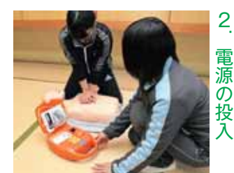
2. 電源の投入 ふたを開け、電源ボタンを押す(自動的に電源が入る機種もある)