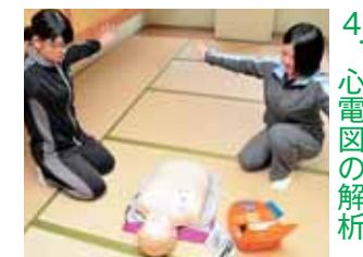
4. 心電図の解析 解析中は、誰も傷病者に触れないようにする