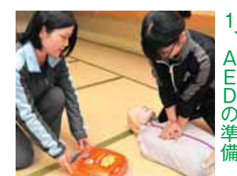
1. AEDの準備 傷病者近くに置く(パッドを貼るまで心臓マッサージは続ける)

AEDの使用は、広報かつやま11月号18Pに記載しました救急蘇生法と併せて行ってください。