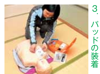
3. パッドの装着 パッドを取り出し、描かれている装着位置を確認してしっかり貼る