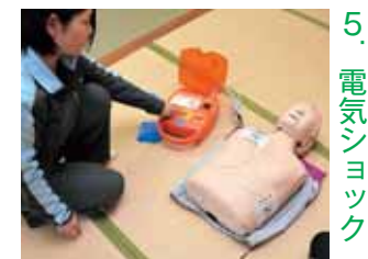
5. 電気ショック 充電完了後、誰も傷病者に触れていないことを確認し、ボタンを押す