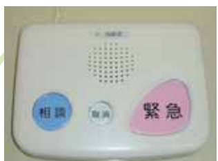
緊急通報システム

対象▼65歳以上のひとり暮らし世帯などで、要介護者として市の名簿(福祉票)に登録されている方の世帯 費用▼無料(ただし通話料は自己負担) 相談先▼地区の民生委員