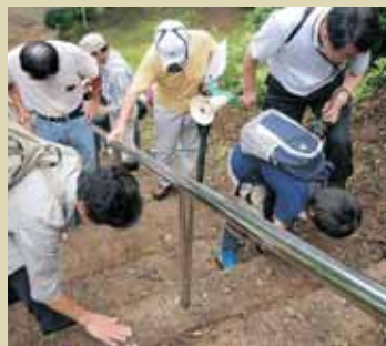
石段に含まれる円礫を探す様子（野向公民館ジオツアーより）

この円礫と深い関係があるのが、市指定文化財名勝の野向町竜谷公園にある200段の石段です。この石段は、牛ヶ谷の石山の栗石を切り出してつくられたもので、石段の一部には、この円礫が入ったものを確認することができます。まさに、竜谷公園は大地と地域の歴史が結びつく場所なのです。