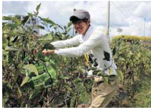
なすの収穫（平泉寺町大渡）