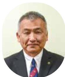
勝山市長 水上 実喜夫