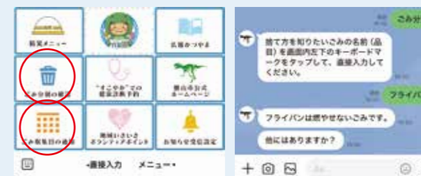
(左)公式LINEのメニュー画面 (右)LINE上での分類確認画面(例：フライパンの捨て方)