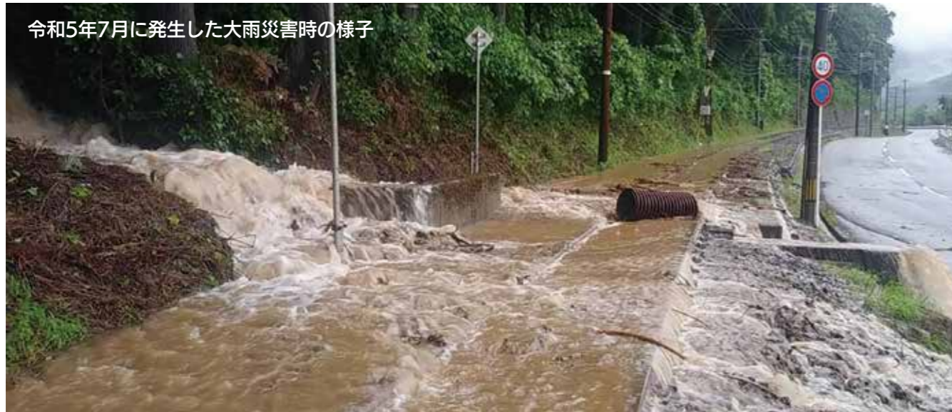
令和5年7月に発生した大雨災害時の様子