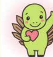
ステナイゴサウルス

物を購入する際は、捨てるもの？リサイクルできるもの？を少し立ち止まって考えてみてください。