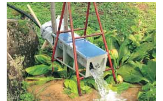
ふるさと納税は、保育園の絵本棚や小水力発電機の購入にも活用されています