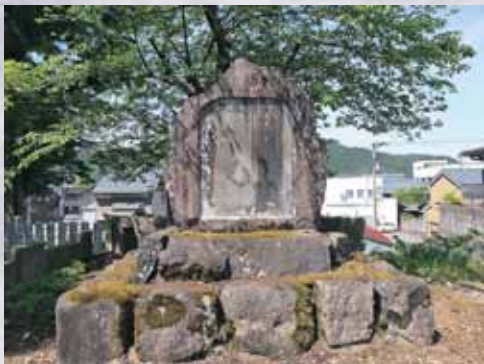
この碑は、市民会館と道を挟んで向かい西側に建っている

季梁（9代通保）は享和元年（1800）に、代々小笠原家の家老職を勤める林家に生まれた。幼名を若三郎と称し、その後、芥蔵・棟・季梁（字名）などと改め、晩年は毛川と号した。