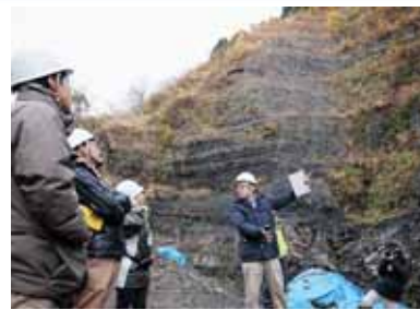
ジオパーク現地視察