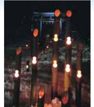
平泉寺燈明プロジェクト