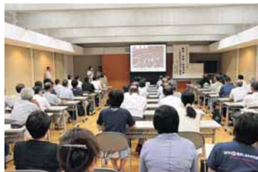
子どもたちの引率で来られた南相馬市職員から同市の現状と課題について講演いただきました