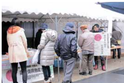
様々なイベントで被災地の物品販売をしました