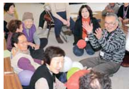
おでかけサロンの様子