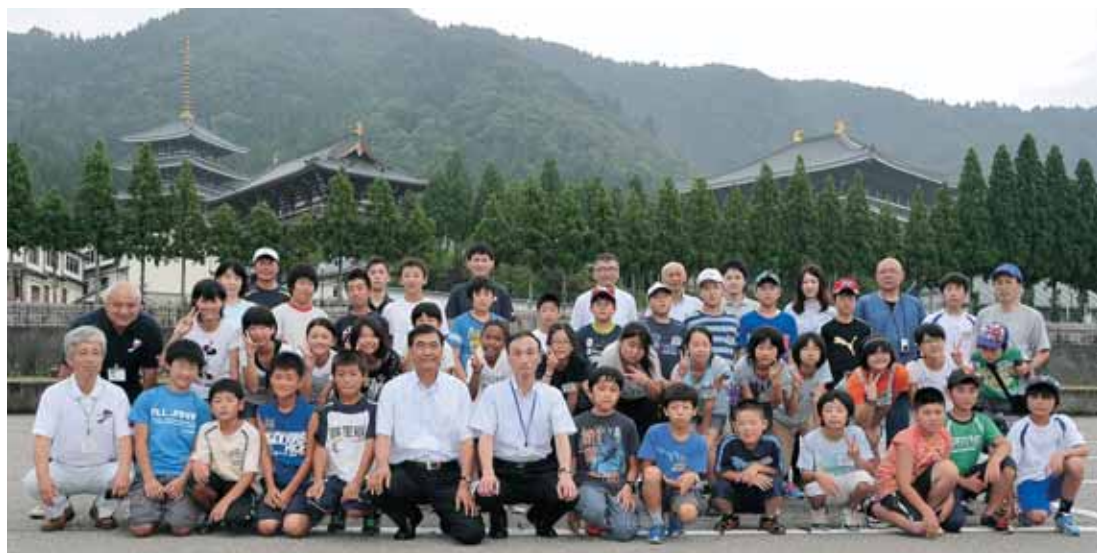
被災地の子どもたちと北郷小学校の児童たち