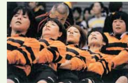
大会での競技の様子。力強く、一糸乱れぬチームワークで闘います。