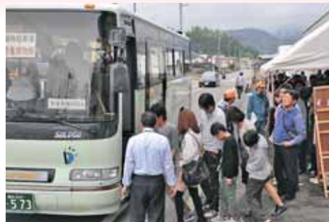
パーク・アンド・ライドの様子