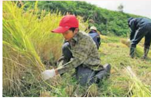
田んぼのオーナー 稲刈り