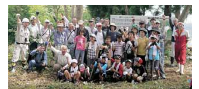
鹿谷町での城山整備

青少年育成勝山市民会議 事務局 ☎87-0101 生涯学習・スポーツ課（教育会館2階） ☎88-8114