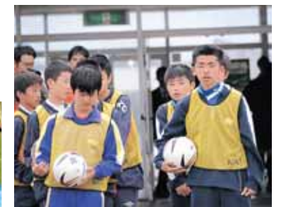
ボールボーイの中学生