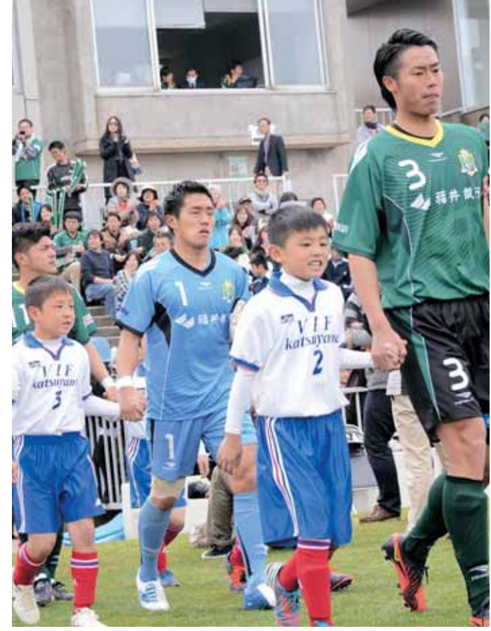
エスコートキッズ