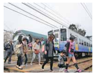
電車・バスで多くの市民が来場

■小中高生も協力 試合運営にも市民が積極的に参加しました。選手入場時のエスコートキッズやボールボーイ、負傷者が出た時の担架隊などを勝山市の小中高生が務めました。 また、試合前とハーフタイムのアトラクションを、それぞれ野向の大日太鼓、勝山のダンスキッズチームが行いました。 勝山からの物販も好評でした。