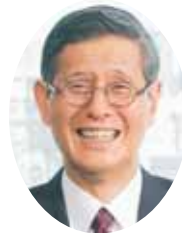
尾身 茂氏 (JCHOトップ)