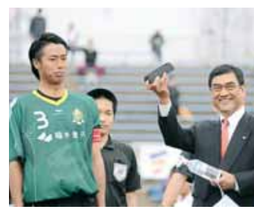
勝山市から記念品の贈呈