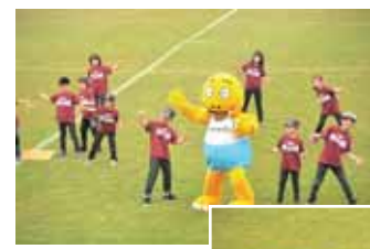
(上下) アトラクションの様子