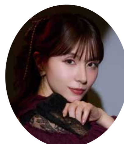
May J. さん