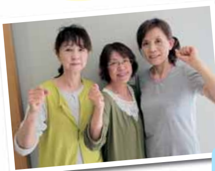
100ポイントをためて景品を勝ち取るぞ!!