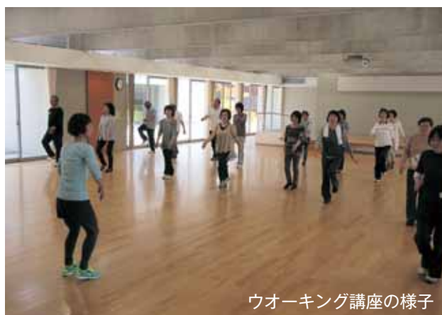
ウォーキング講座の様子