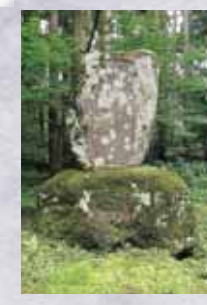
たため辞退した。一方、官有林を管理する、現在の林野庁に当たる農

碑には福井県の自由民権運動に活躍した杉田一題額、佐賀藩出身の儒学者である谷口藍田の撰と記されている。藍田との関係はわからないが、杉田定一とは如芥自身も自由民権運動にかかわったことによるものであろう。碑文には彼の功績を中心にその履歴や人柄が記されている。「平泉寺史要」なども利用しながら、如芥の履歴と事績について紹介していく。明治6年、敦賀県第29大区小1区(平泉寺・大渡・岡横江・赤尾・笹尾村)の戸長に選任された。その後、石川県会議員に選ばれたが産業開発に尽力中であったため辞退した。一方、官有林を管理する、現在の林野庁に当たる農