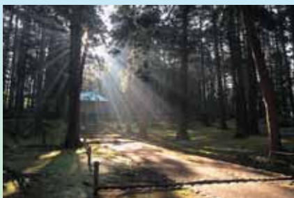
H20白山・平泉寺部門 特選「照らされた道」