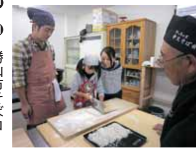
そば打ち体験の様子

そばオーナーになって、美味しいそばを作ってみませんか。種まき、収穫、そば打ちの三回シリーズです。そば種まき体験・そば試食 とき▼8月9日(出) 午前9時30分〜正午 ※収穫体験は11月上旬、そば打ち体験は12月上旬を予定 ところ▼野向町聖丸区 募集区画▼20区画(先着順、1区画4名まで登録可能) 費用▼1区画(1000円) 8000円 ※そば打ち体験は別途1500円かかります 申込締切▼8月5日(火)