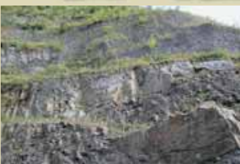
恐竜化石が眠る縞々の地層

地は、地球のプレート運動により中国大陸から徐々に引き離され、日本海、そして、現在の日本列島が形成されていきます。勝山市で発見される恐竜化石は、その変動する大地とともに大陸から勝山にやって来たのです。 恐竜化石が眠る地層は、今から約1億2000万年前の白亜紀前期のもので、そこから発掘された恐竜の化石や足跡化石などから進化の過程や恐竜の行動パターンなどが明らかになってきています。そのほか恐竜化石だけでなく、淡水生物、哺乳類などの化石も一緒に発見されています。それらについても、恐竜時代の勝山市の古環境を解明する手がかりとなるものであり、恐竜化石と同様にとても貴重なものと言えます。