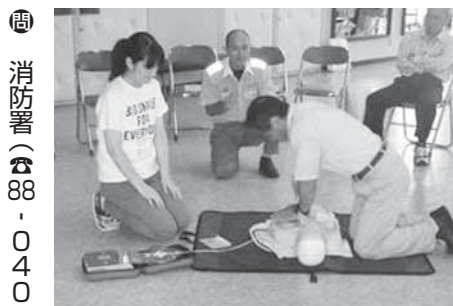
普通救命講習の様子