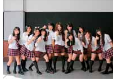
おやゆびプリンセス