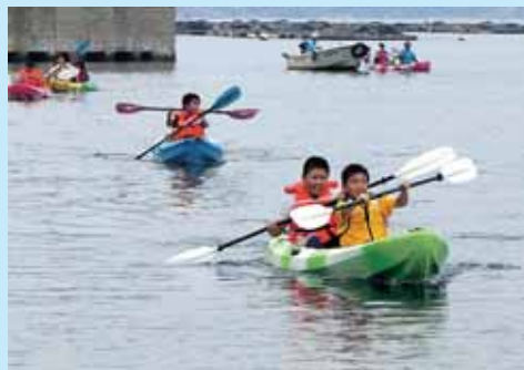
写真左：釣り堀で鯛が釣れました。 写真上：シーカヤックでスイスイ

2日目は若狭塗り箸作り体験や、遊覧船観光などで交流しました。 来年2月には小浜市の子どもたちが勝山市を訪れ、スキー体験や、恐竜博物館見学などを行う予定です。 両市は、これから観光・物産関係でも相互に交流事業を行っていきま