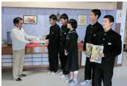
校区の公民館に下記のチラシを配布し協力をお願いしました