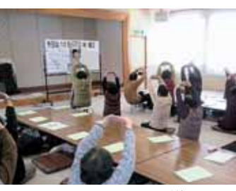
お出かけサロンの様子