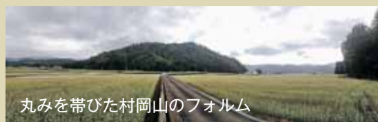
丸みを帯びた村岡山のフォルム

村岡山は、恐竜時代末期(勝山)がまだアジア大陸の東端にあった頃の火山活動により形成された全体が溶岩の標高301mの小山です。村岡山は、今から約6500万年前、手取層群の地層を突き破るよう地下からマグマが噴出し、その結果鐘状になった山が侵食や風化され現在のかたちになったと考えられています。村岡山をつくる溶岩は比較的硬いため、侵食や風化に耐え、丸みを帯びた山容をしています。