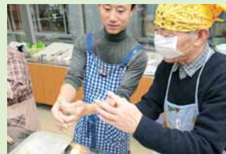
昨年の餃子づくりの様子