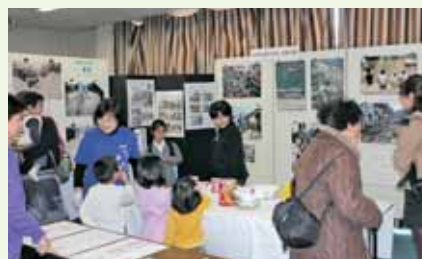
村岡公民館での防災ブース展示の様子

ハーモニーホールでの「避難訓練コンサートへの参加」を皮切りに、村岡小学校4年生のわくわく通学合宿での「防災講座」、高齢者ときめき