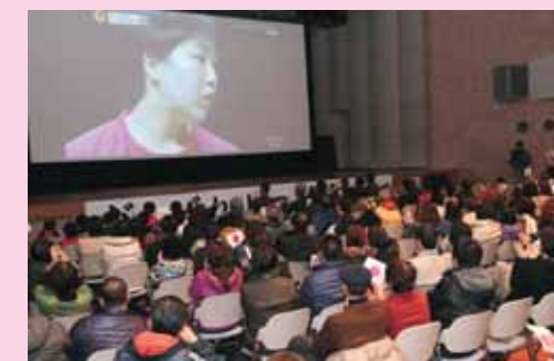
パブリックビューイングの様子(市民会館)

勝山バドミントン協会と勝山市が主催し、12月20日の準決勝のパブリックビューイングを実施。約400人が応援に集まりました。