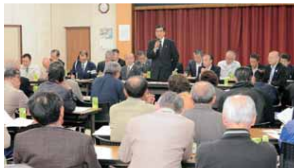
市長と語る会の様子（10月23日 鹿谷公民館）