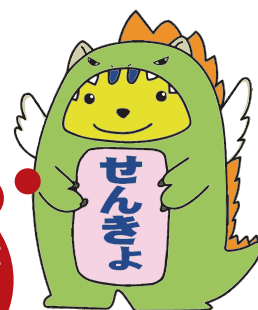
明るい選挙キャラクター 福井県版「めいすいサウルス」