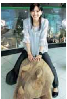
県立恐竜博物館にて

皆さまのご協力により様々な活動を行うことができました。これからも勝山での暮らしを楽しみながら、その魅力を発信していきます。