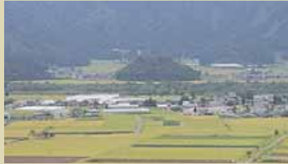
勝山城博物館展望台から見た大袋

人に名前があるように、私たちが住む大地にも名前すなわち「地名」があります。地形と自然災害といったジオパークの視点から、勝山に見られる地名の由来の例を紹介いたします。