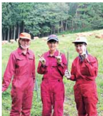
田舎暮らし体験の参加者たち

①田舎暮らし体験のコーディネート 今年も100人以上の方が東京や大阪、海外などから参加しました。受入先と参加者のつなぎ役として、滞在時のフォローをしています。