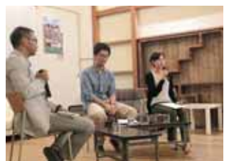
大阪でのイベントの様子