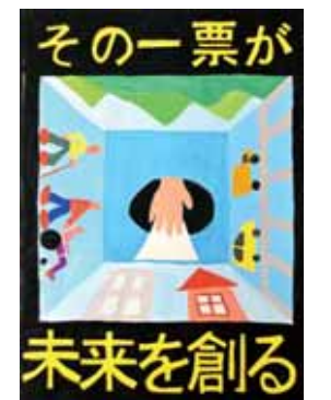
平成26年度勝山市明るい選挙啓発ポスターコンクール 中学生の部 最優秀賞 長岡大照さんの作品