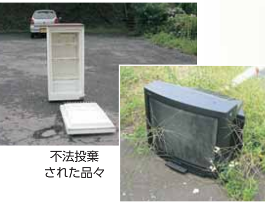
不法投棄された品々

ごみ(廃棄物)を河川や山林、空地、道路わきの茂みなどに捨てる事例が後を絶ちません。法人などの事業活動に伴い出る産業廃棄物はもちろん、私たちの生活から出る一般廃棄物であつてもみだりに捨てることは廃棄物処理法で禁止されています。 この法律に違反してごみを捨てた場合、法人などの場合は3億円以下の罰金、個人の場合は5年以下の懲役もしくは100万円以下の罰金が科せられます。 市内でしばしば見かけられる次の事例も、ごみの不法投棄にあたりますので、絶対に止めてください。