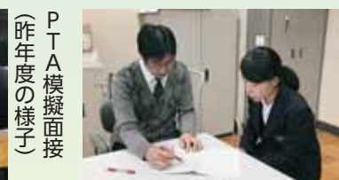
PTA模擬面接(昨年度の様子)