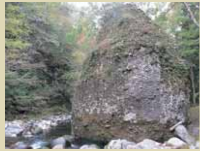
滝波川河床の巨大な岩塊

自然の中を歩き回ると、その時々で発見があります。もちろん、科学的な大発見というのはなかなかありませんが、自分がこれまで見たことのなかったもの、近くを通っていたのに気付かなかったものに巡り合うことがあります。今回は、ここ最近、歩き回って見つけたものを紹介します。