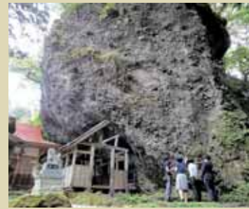
大矢谷白山神社の巨大岩塊

これから一日一日、寒さも増して冬に近づいて行きます。今シーズン残された数少ないチャンスを活かして身近な自然に触れ合い、思考ゲームを試してみませんか。