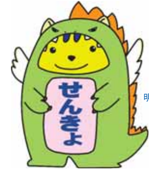
明るい選挙キャラクター 福井県版 「めいずいサウルス」

選挙は、私たちの暮らしの中の願いを実現するための最も有効な手段です。一人ひとりが自覚と良識をもって一票を投じましょう。