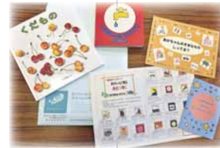
ブックスタートパック例