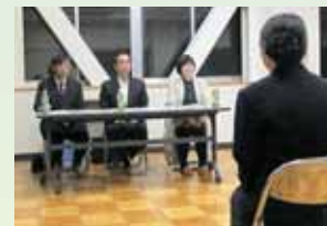
PTA模擬面接(昨年度の様子)

面接指導や小論文の指導は、教員・PTA・シニアティーチャー(退職教員)の協力の下、個別指導を基本にしています。