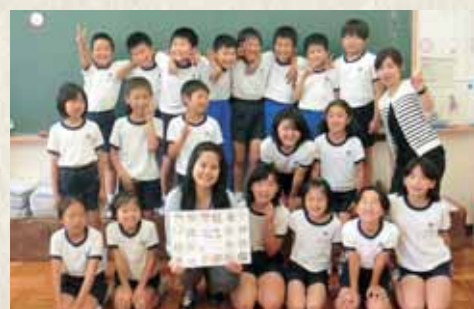
村岡小学校の児童たち