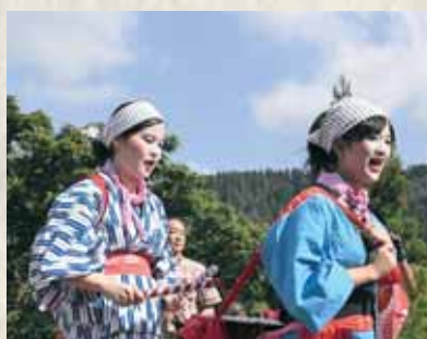
谷はやし込み行列にて

国際交流サロン、大人の英会話教室、日本語学習広場の参加者の皆さんは、いつも私を気遣ってくれ、冬を一度も経験したことのない私にアドバイスをくれました。そのアドバイスがなければ、私は冬を乗り越えることができたかわかりません。この方々は、私のいろいろな相談に乗ってくれ、勝山・福井の魅力をたくさん教えてくれました。 小学校で英語を教えている子どもたちからは、町中