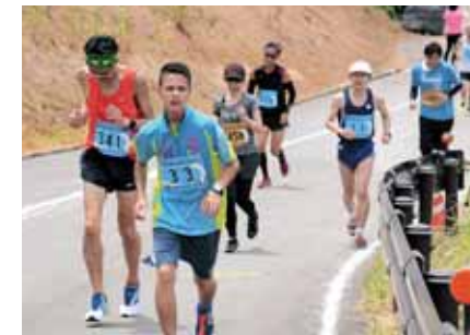
ゴールまであと一息