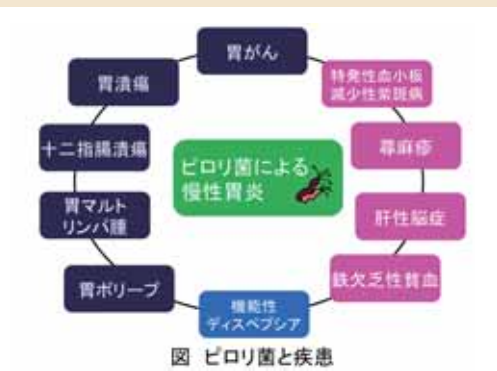
図 ピロリ菌と疾患

ピロリ菌は、日本人の約半数の人が感染しており、高齢者ほどピロリ菌の感染率が高い傾向にあります。基本的には経口感染で、乳幼児期に汚染された井戸水や母親などの家族から感染することが多いとされています。