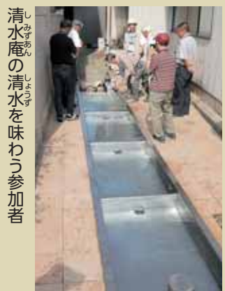
清水庵の清水を味わう参加者

黒部川の作ったスケール感のある扇状地・河成段丘の特徴に感銘を受けている参加者が多くいました。また、急流河川である黒部川は、恩恵をもたらすと同時に災害ももたらしてきました。うなぎき友学館や愛本橋、バス内での解説を通し、河川災害と恩恵を得るための人の知恵(用水や堤防など)