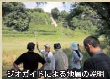
ジオガイドによる地層の説明

を学びました。さらに、ジオツアーに参加し、ジオガイドに案内してもらうことで、ただの「崖」が「意味のある地層」であることを参加者も実感できたのではないのでしょうか。扇状地の扇端部にあたる生地帯には、至る所に湧水があり、その豊富さに驚かされました。「扇状地の扇端部は湧水が豊富」という知識をもつてはいても、実際に見て、触れて、体験するのは違ってしまうことが実感できました。