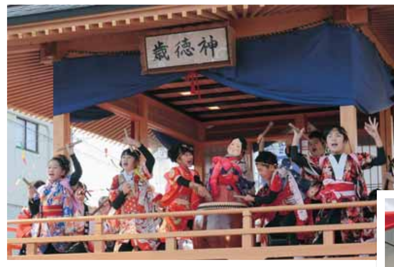
子どもばやし (沢区)