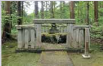
墓には「楠木正成」と告げた。恵秀は不思議に思い損津に人を遣わし、確かめたところ間違いなかったため、碑を建て申った。