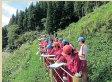
野外恐竜博物館で地層を観察する様子

勝山市の小中学校では、ジオパーク学習を実施しています。教科書を使って教室で学ぶことも大事ですが、実際のものに触れ、野外での体験を通して学ぶこともとても大切です。今年度は9～11月にかけて、成器南小学校、成器西小学校、三室小学校、村岡小学校、野向小学校、鹿谷小学校、勝山北部中学校で行いました。 小学校5、6年生では、それぞれ「流れる水のはたらき」、「大地のつくりと変化」について学ぶ授業があります。勝山を流れる九頭竜川やその他の支流で実際の川の様子を見たり、恐竜化石の発掘現場を見学に行ったりしました。恐竜化石が実際に見つかった地層を見学に行ける授業は、他の地域に住んでいてはなかなか経験することができません。中学校では、火