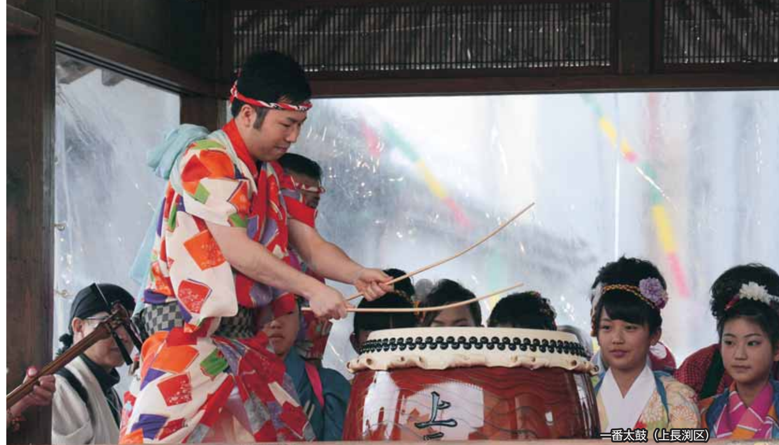
一番太鼓 (上長洲区)

■各コンクールが開催 日常生活道具を素材にして、その年の干支や吉祥にちなんだものを形づくる「作り物」と、風刺の効いた川柳に絵を添えて楽しめる「行燈」。両コンクールの審査が25日に行われ、昨年に引き続き、どちらも芳野区の作品が勝山市長賞を受賞しました。 また、26日に行われた子どもばやしコンクールでは、沢区が初の勝山市長賞に選ばれました。 ※コンクール結果は前ページ参照