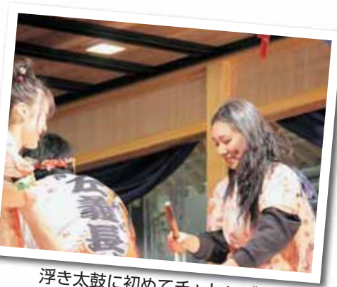
浮き太鼓に初めてチャレンジ!

Since it became winter, I have been looking forward to the Katsuyama Sagicho Festival! On Sunday, many of the other ALTs from different places in Fukui were able to come to Katsuyama City. It was a very special day because it was some people's first time going to a Japanese festival. We enjoyed the traditional performances from the yaguras as well as the dondoyaki. We were also able to go on top of a yagura and hit the taiko which was very fun. I am very happy to have experienced many new things at Sagicho Festival.