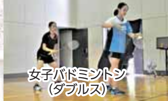
女子バドミントン(ダブルス)