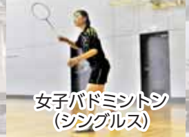
女子バドミントン(シングルス)