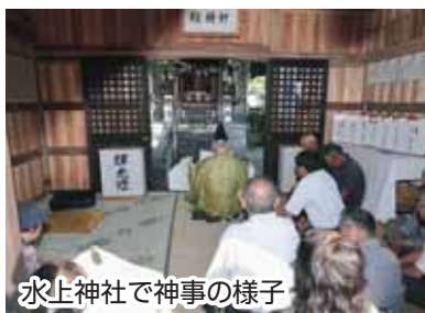
水上神社で神事の様子 のただれた者を偽りとする裁判法が行われていた。この神事に因んで来ると考えられる。

例年9月8日が当村の村祭りであり、かつては山伏により御祈禱があげられた。一方、神社境内に大きな金をすえ湯が沸かされており、祈禱が済むと笹葉で村民に湯がふりかけられた。湯がかかると病気になる、頭が良くなるなどと言われた。いわゆる「湯立(湯の花)神事」と言われるものである。修験者が熱湯に笹をひたし湯玉(湯の花)を参拝者に振りかけ、神意をうかがったり身を浄める神事である。当村では「くがたち」と称し伝えられていたようだが現在では行われておらず、勝山神明社の宮司による祭礼の儀式が行われている。古代日本では「盟神探湯」といって、熱湯の中の石を拾わせ手