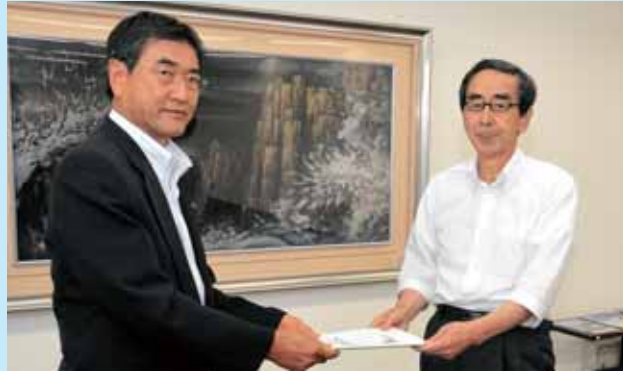
要望書を手渡す山岸市長(写真左)

8月29日、山岸市長、帰山市議会議長、松井県議会議員、松村副市長および関係部長が県庁を訪れ、一丸となって勝山市が福井県に対して強く要望する内容をまとめた要望書を提出しました。