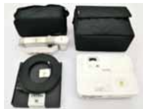
プロジェクター一式