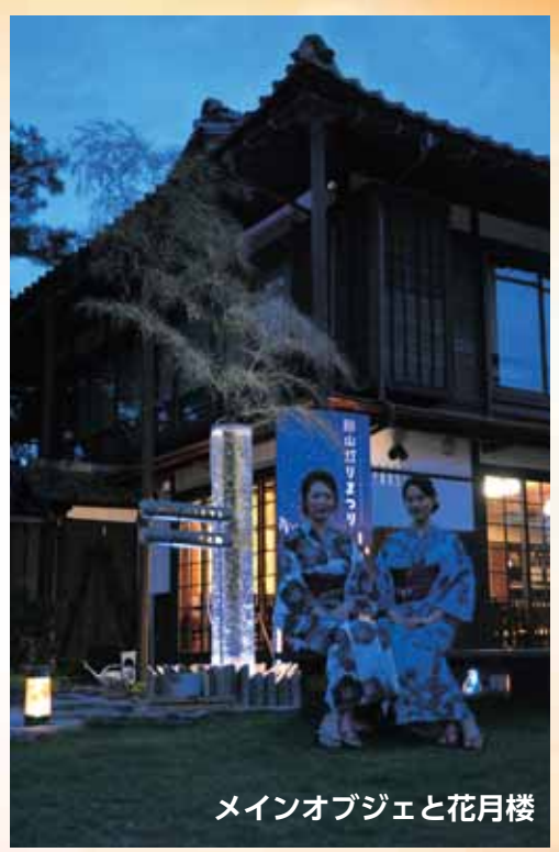
メインオブジェと花月楼