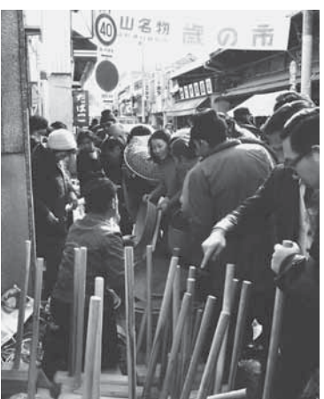
昭和52年の年の市の様子

今回は「年の市」を紹介し、例年1月の最終日曜日に行われる「年の市」について、「大野郡誌」には「師走の26日に本町通りで年の市が行われ、近郷山家の素人商人・町商人・旅商人を交え、早朝より定められた場所に忙しく店を出す。神仏の棚飾、年頭の縁起物、台所用具、下駄、その他食料品に至るまで街中に陳列する。これらを買求める四方から多くの人が集まり喧噪を極める」と記されている。 正徳3年(1713)の志比原の史料には「当村近郷の市場は小笠原様の城下勝山と申所である」、文化8年(1811)の堀名中清水村の史料には「勝山城下では月に6回の市が立ちそこで万事諸商事が行われる」と記され、勝山町が近郷農村の経済の中心であったことがうかがえる。同町の延享5年(1748)の史料には年間の市について記され、「三月初日之市」「半夏生」続いて6月1回、7月3回、8月1回、「十