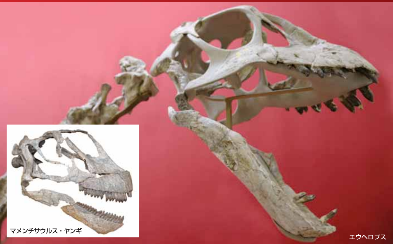
マメンチサウルス・ヤンギ