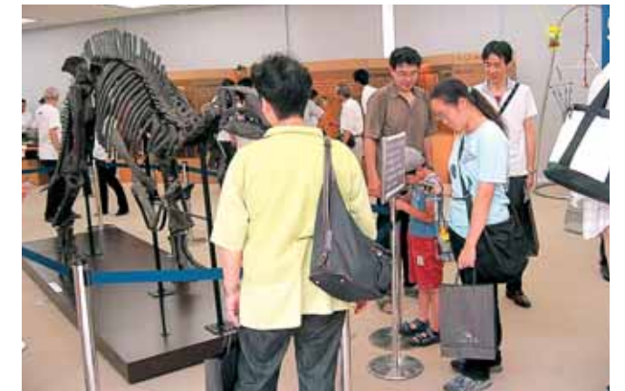
にぎわう会場内 恐竜化石も人気でした