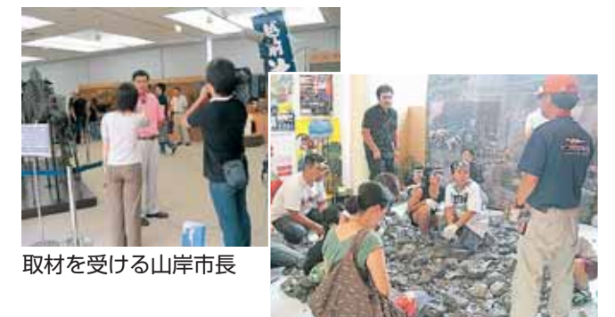
取材を受ける山岸市長 化石発掘体験も大人気