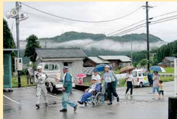
災害時要援護者の避難誘導状況（保田区）

今後も地域の自主防災組織と協力し、さまざまな場面を想定した訓練を実施していくことで、災害に強いまちづくりの実現を目指します。