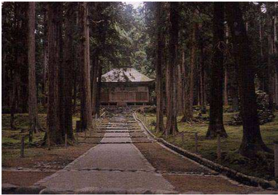
白山平泉寺旧境内