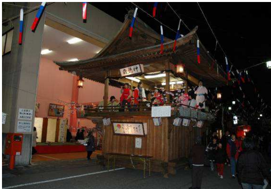
左義長櫓（上袋田区）