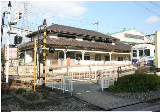
えちぜん鉄道勝山駅本屋