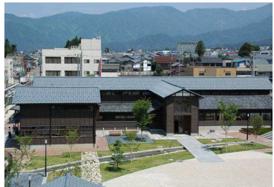
はたや記念館ゆめおーれ勝山