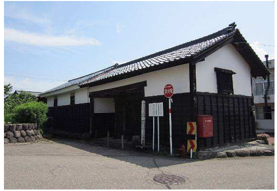
旧成器堂門・旧成器堂土蔵