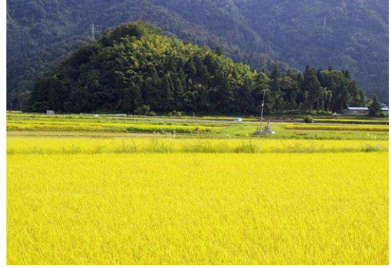
三室遺跡（縄文時代）