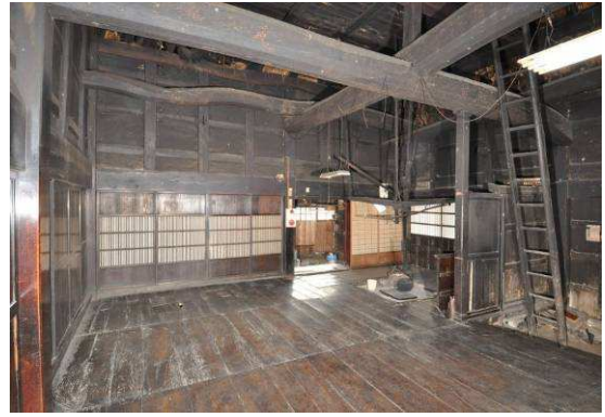
旧木下家住宅（内部）