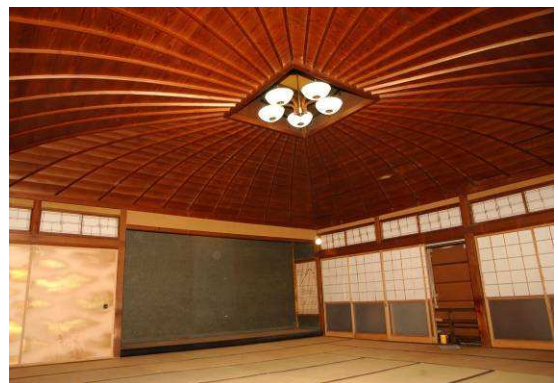
旧料亭花月楼 2階大広間