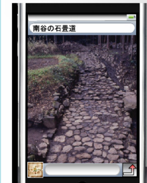
現地の説明 & 写真

平成3年に発掘されたこの石畳道は、今からおよそ500年前の室町時代につくられたと考えられます。同時期の国内では他に例のない規模です。これらの石の多くは角の丸い川原石で女神川から運ばれてきたと考えられます。