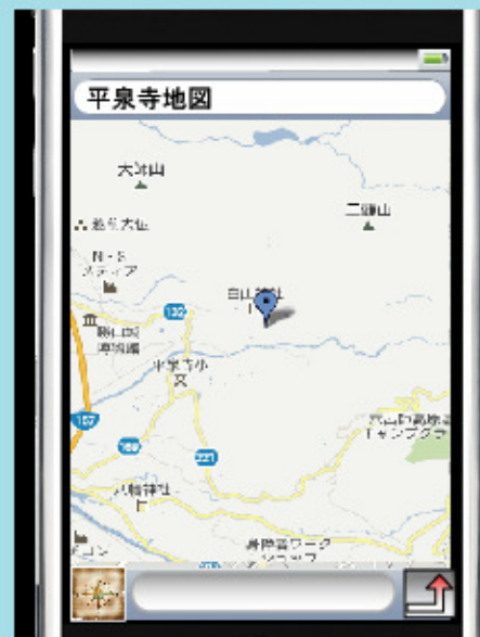
地図に切り替えて