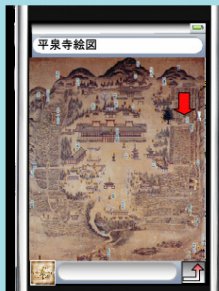
平泉寺の絵図に自分の位置↓を表示

表紙の写真のような最先端の機器を用いて平泉寺を調査し、その成果を来訪者の案内に利用していく計画です。たとえば、スマートフォン、携帯端末などを使って、平泉寺を訪れた人それぞれの興味関心に沿って、平泉寺の歴史を楽しみながら歩ける新しい史跡案内を考えています。