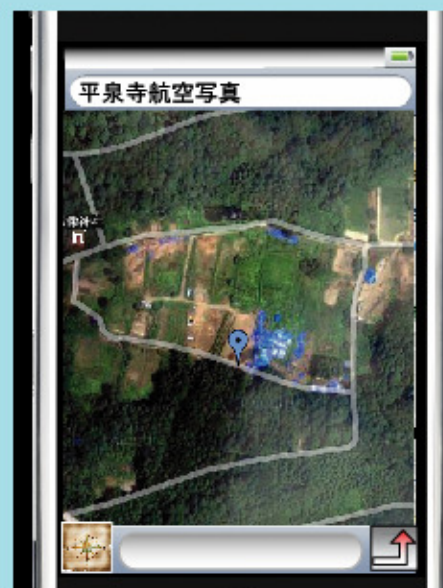
航空写真に切り替えて