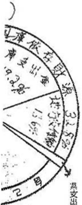
(別表2) 財産公債及び一時借入金現在高 (昭和29年9月30日現在)

我が勝山市は新たに誕生しましたので、地方自治法施行令第二条により歳入歳出共に総額三九、〇〇〇、一七円の暫定予算を調製して執行してまいりました。その予算内容を図解しますと次のとおりでありましてその執行状況は別表一のとおりであります