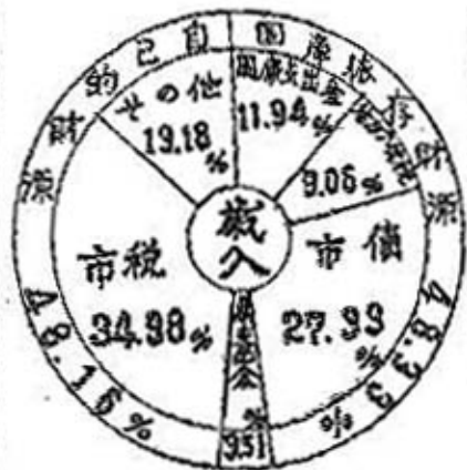
昭和30年度勝山市一般会計歳入歳出予算現况