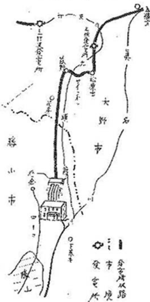
壁倉発電所見取図

市内にこんななりつばな発電所ができることは誠に喜ばしいことです。 わけでもこの神武以来の大工事が市内で施工されるようになって、その約二割(金額にして四億)が地元をうるおるといふことになりますと、現場の平泉寺町は勿論のこと市内は、それこそ打つて交つたようににぎわうことでしょう。