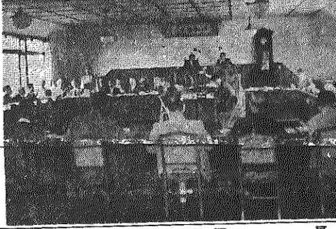
山内市長 現在段階では財政上の困難と思っています...