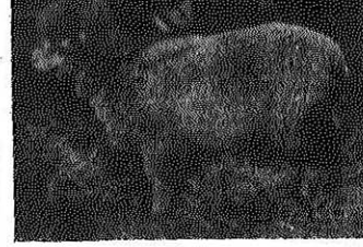
めん羊部をたずねて

人間社会でも、めん羊を飼う……農家のめん羊を飼います。人間社会でも、めん羊を飼います。人間社会でも、めん羊を飼います。