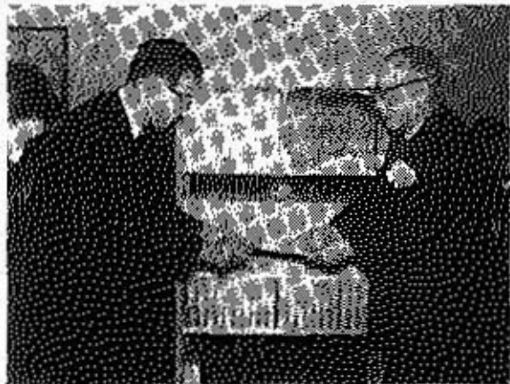
(R.Cからの寄贈をうける血沢助役)

ことしの成人式は二十一日午前九時半からまず成人になられたみなさんを祝福する式典が行なわれ成人記念品として人生読本、青雲々と印鑑セットの贈呈、健康診断書の授与、成人論文入賞者の表彰