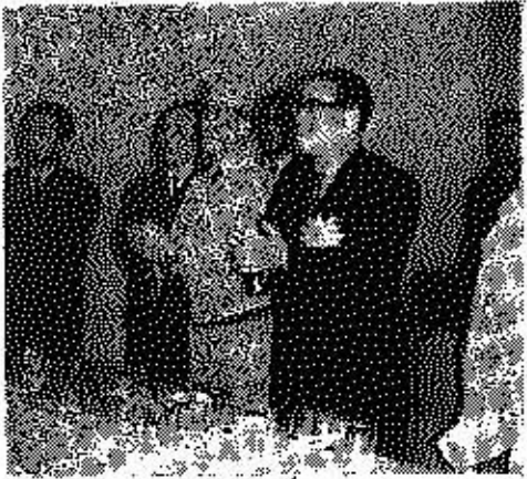
(メインスイッチを押した北福知事)

そしてこれら配分金の経理については監査委員の厳正な監査をうけ、さらに理事會の承認を得た上