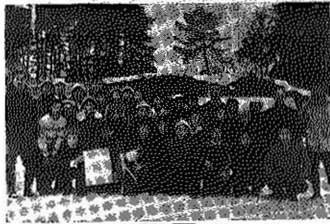
(中学の部で優勝した村岡中チーム)

めるなど大会の運営に協力、選手もまた大いに健闘し、結局一般女子では常勝大野市を破って初優勝をなすとげ、中学の部では村岡中学校が二回目の優勝をしました。