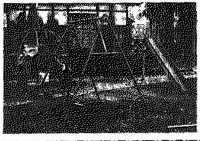
(写真は岩ヶ野の児童小遊園地)

遊園地には、ブランコ、スベリ台、ボールジャンプなどが設備されていて、高層の子供たちは大喜びで遊んでおります。