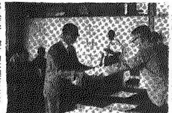
(表彰をうける自治功労者)