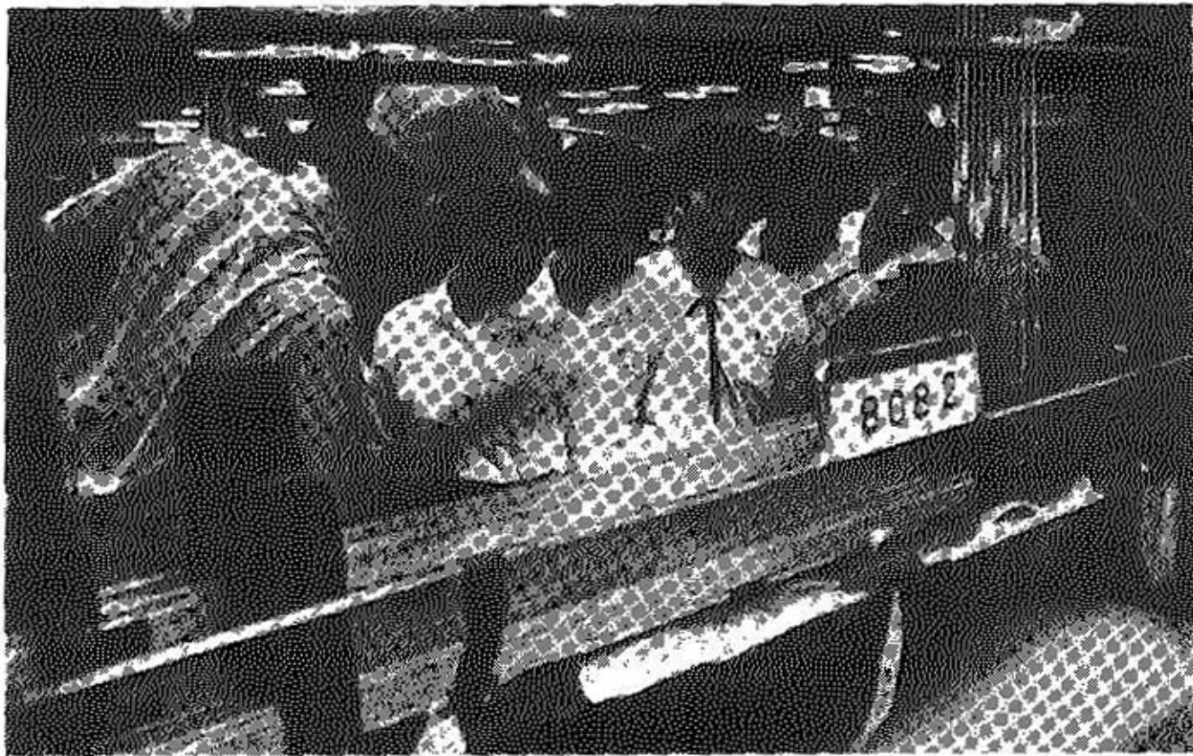
来春の 中卒者 胸ふくらませ工場見学

来春中学校を卒業して市内に就職する生徒たちが、市内の繊維工場を見学しました。勝中百名、中部中五十名、北部中八十一名、平泉寺中二十二名、合計二百五十三名が、工場から出迎えのマイクロバスに乗り、山岸あさひ工場、松文本社工場、協和長山工場、白木第三工場、兄弟伊波工場の五工場を訪れ、各係からあたたかい説明と案内をうけました。