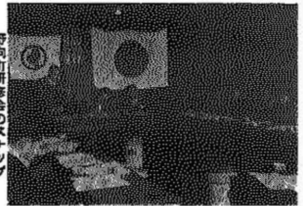
野向町研修会のスナップ