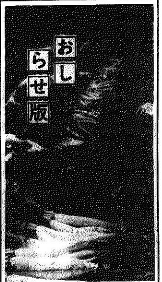
芳野ヶ原特産夏大根 出荷たけなわ

本人が申請されるときは印鑑手帳と認め印を持ってきてください。 代理人のときは、依頼人の印鑑手帳と自書押印した委任状に代理人の認め印を捺印してください。委任状の様式は印鑑手帳を見てください。