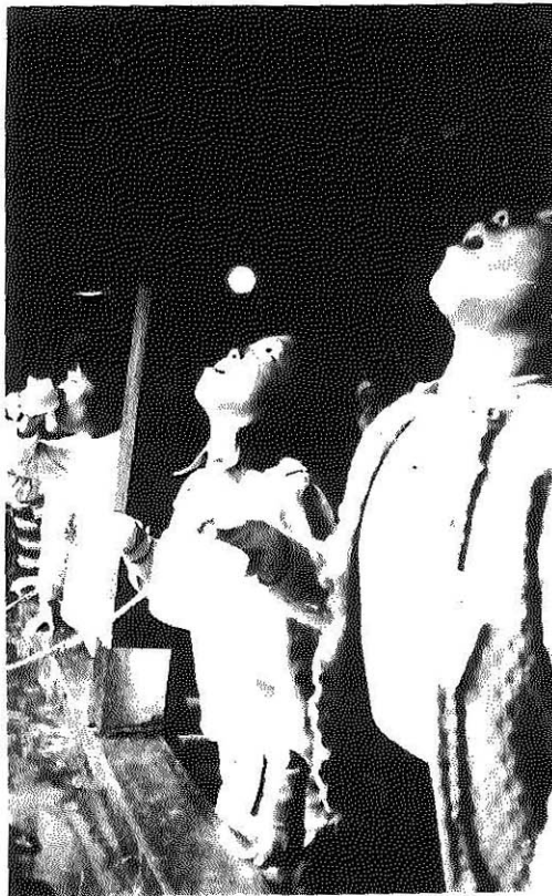
うがいを励行する児童ら

突然三十八〜四十度の高熱で 発病、頭痛、腰痛、全身倦怠な ……どのの痛みやせき、鼻汁な ……と呼吸器症状が出てきます。