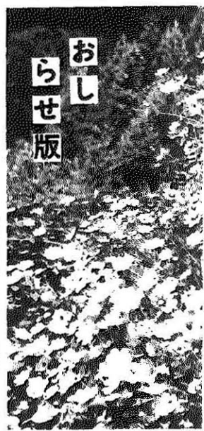
かれんなコスモス