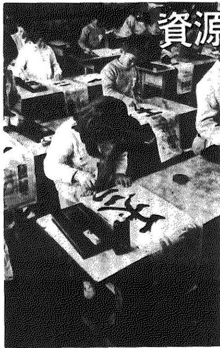
紙節約で復活した新聞紙の草紙で お習字をする児童ら (鹿谷小学校で写す)