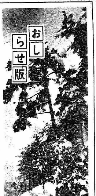
快晴の空へのびる松は雪化粧していた。自然を大切に(雁ヶ原で)