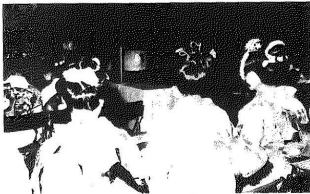
「NHK青年の主張コンクール全国大会」を視聴する新成人ら

降り続いた雪もやんだ成人の日、勝山市では男二百四十一人、女二百五十七人、計四百九十八人の新成人が誕生しました。市教育委員会は、この日市公会館で新成人の新しい門出を祝う成人式を盛大に行いました。