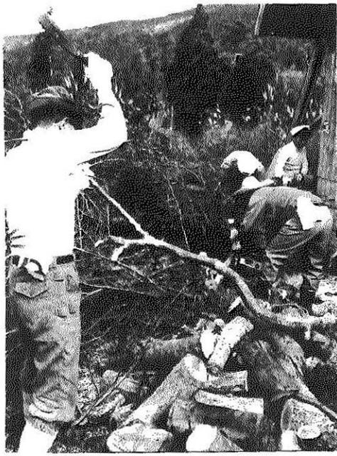
避難者用のまき作りに精出す市職員—中の平で

市商工観光課はこの程、法恩寺山(標高一、三五六)のふもと中の平にある避難用の山小屋を整備、冬の避難者用のまき作りをし、一シーズン分を蓄えました。この山小屋は冬山登山者やツアースキーの人たちに欠くことのできない避難用の大切な山小屋で、こしも冬を目前に控えて同課の職員ら五人が小屋の清掃やまき作りしたもので、見事な紅葉に囲まれた山小屋の前で雪折れたたけなをチェーンソーやナタで伐採し、燃やしやす